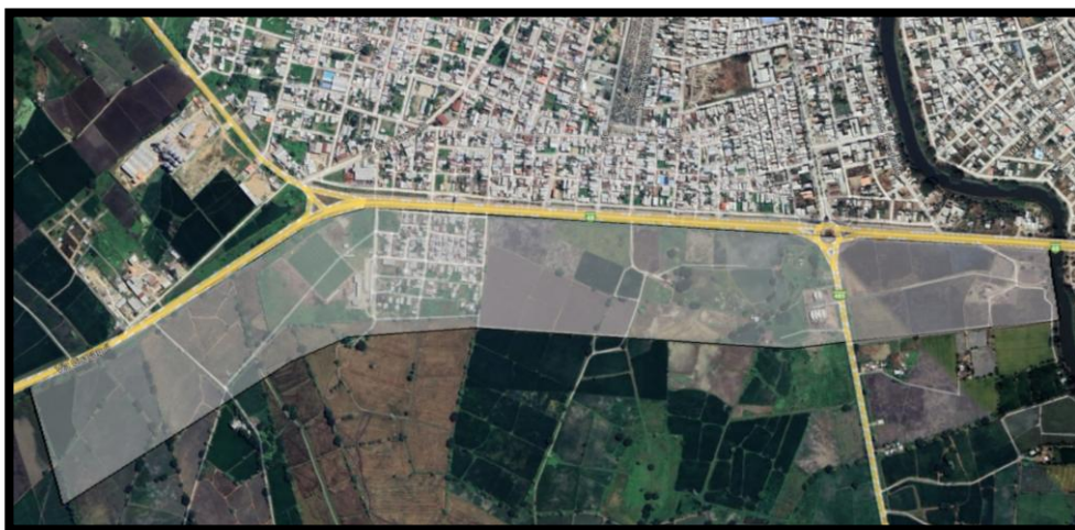
Figura 2. Delimitación de la zona urbana a desarrollar en cabecera cantonal de Daule

En las figuras 1 y 2 se muestran las áreas delimitadas de las zonas urbanas del cantón Daule para las cuales de deberá elaborar el plan maestro y desarrollo hidráulico-sanitario, a diferencia de plan maestro vial que es para el cantón.