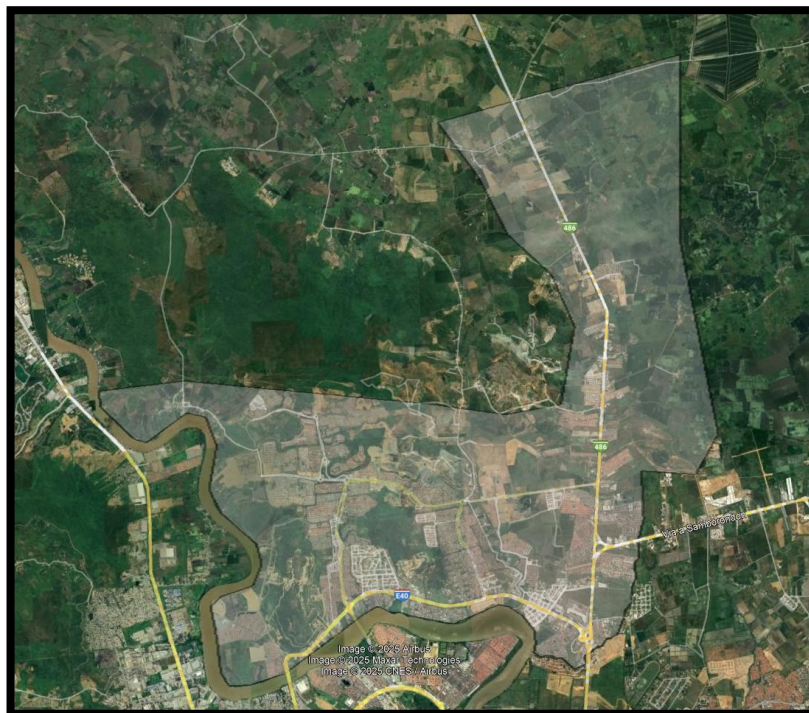
Figura 1. Delimitación de la zona urbana en parroquia satélite La Aurora