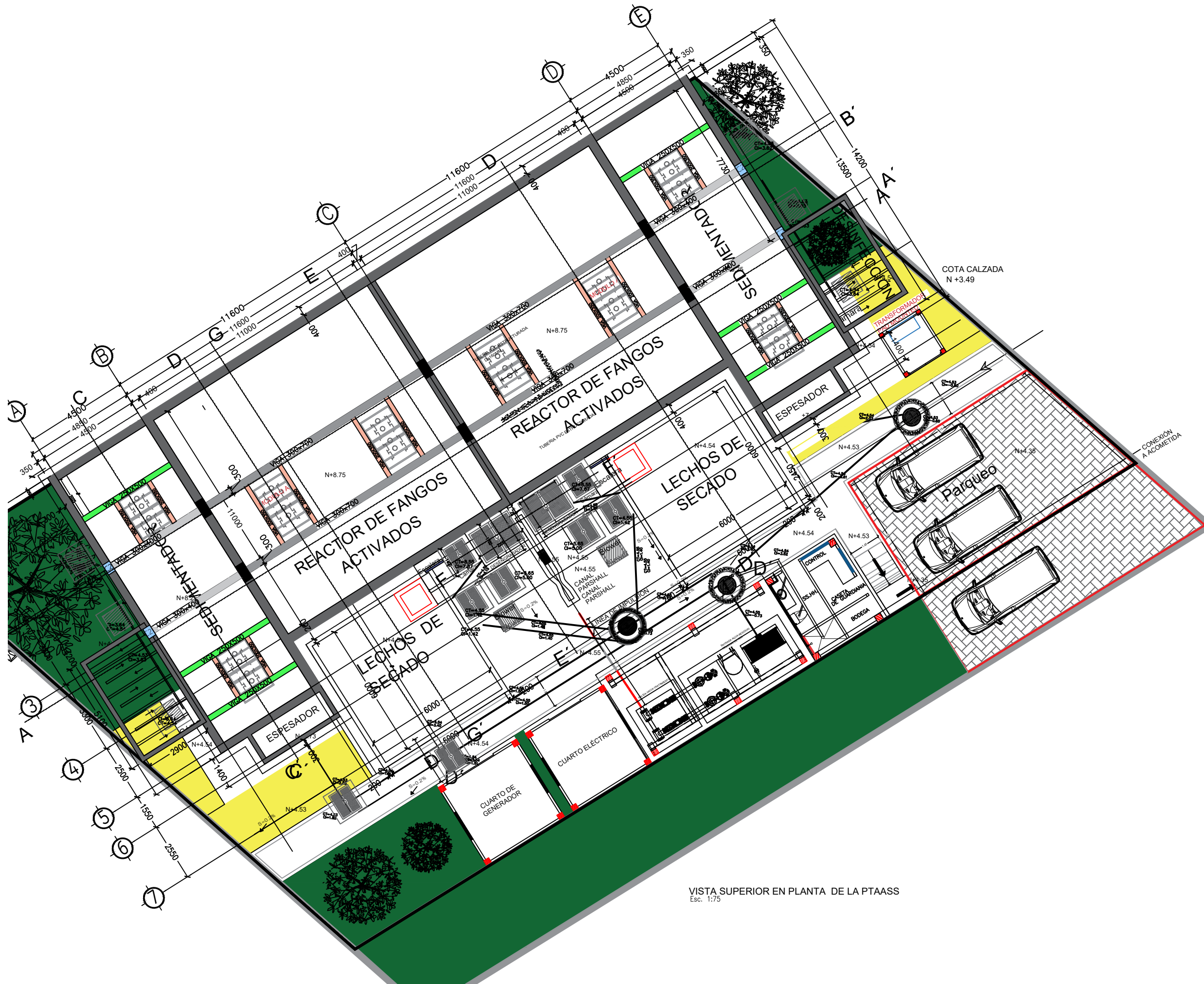
VISTA SUPERIOR EN PLANTA DE LA PTAAS Esc. 1:75