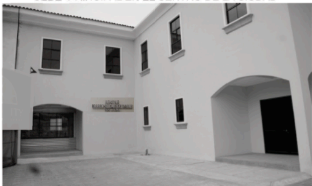
SEDE ALTERNA EN LA PARROQUIA URBANA SATÉLITE LA AURORA