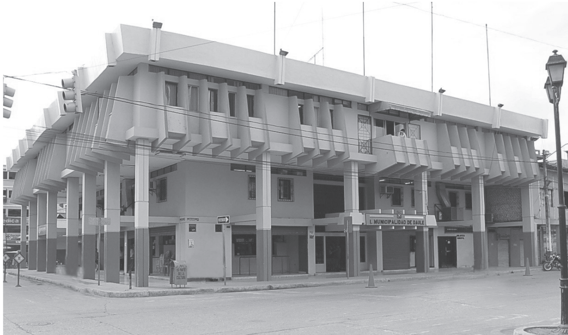
SEDE PRINCIPAL EN EL CENTRO DE LA CIUDAD