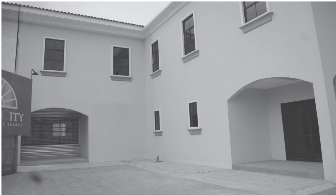
SEDE ALTERNA EN LA PARROQUIA URBANA SATÉLITE LA AURORA